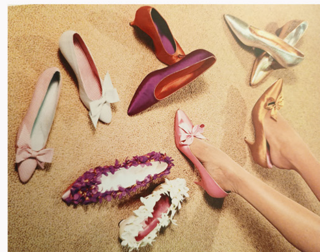
ELEMENTY KOSTIUMÓW I REKWIZYTY HELEN