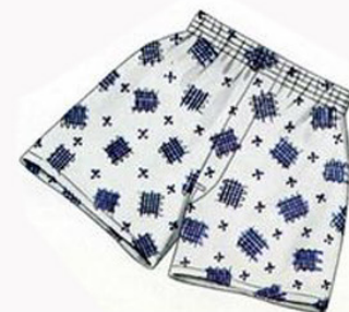
DŁUŻSZE SPODENKI Z WZORKIEM