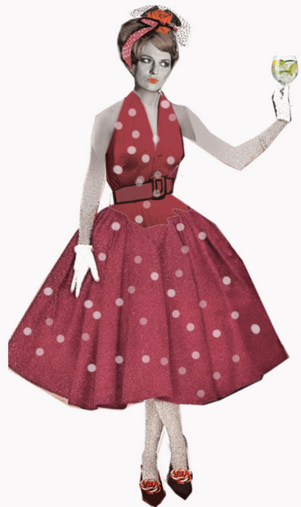
KOSTIUM NUMER 2 - WIECZOROWY