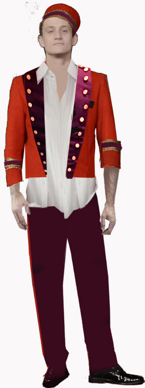
UNIFORM ZUŻYTY LEKKO..