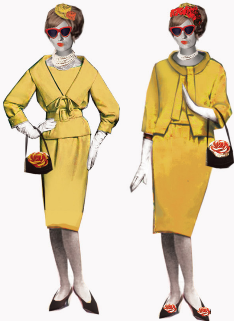
KOSTIUM NUMER 1 - PRZYJAZD