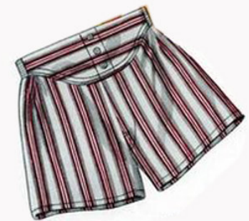
SPODENKI Z WZORKIEM