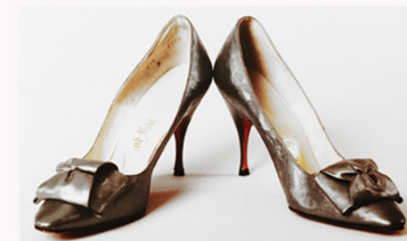
ELEMENTY KOSTIUMU I REKWIZYTY SALLY