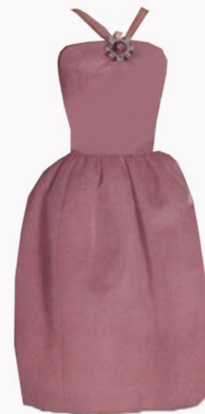
KOSTIUM NUMER 3 - WIECZÓR