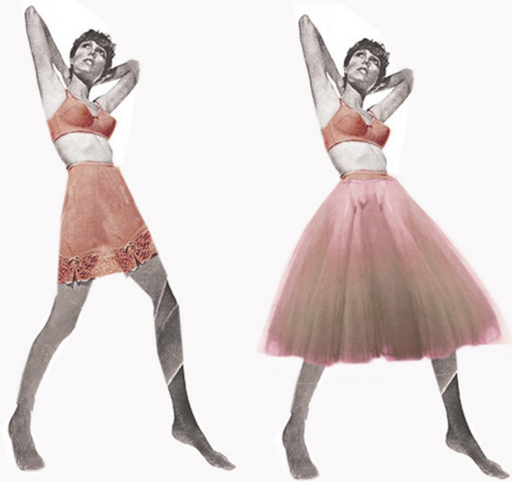
KOSTIUM NUMER 2 - COŚ SEKSOWNEGO I SKĄPEGO