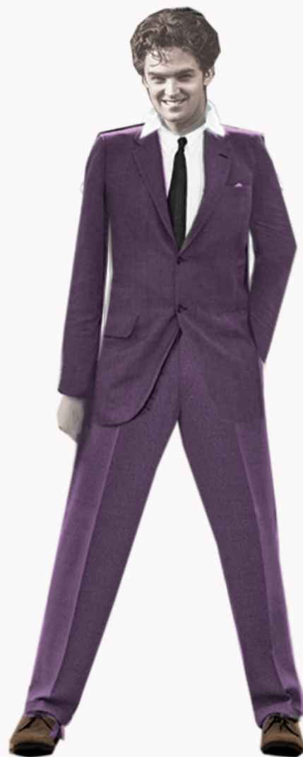
KOSTIUM NUMER + MARYNARKA