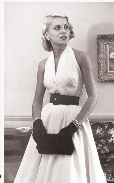
KOSTIUM NUMER 2 - WIECZOROWY