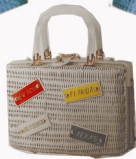
KOSTIUM NUMER 1 - PRZYJAZD