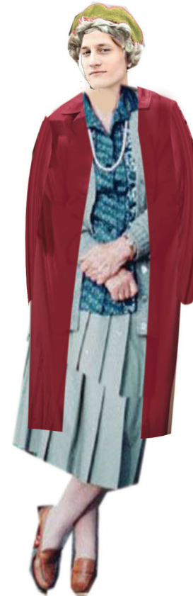
PERUKA- TRESKA Z BEREKCIEM