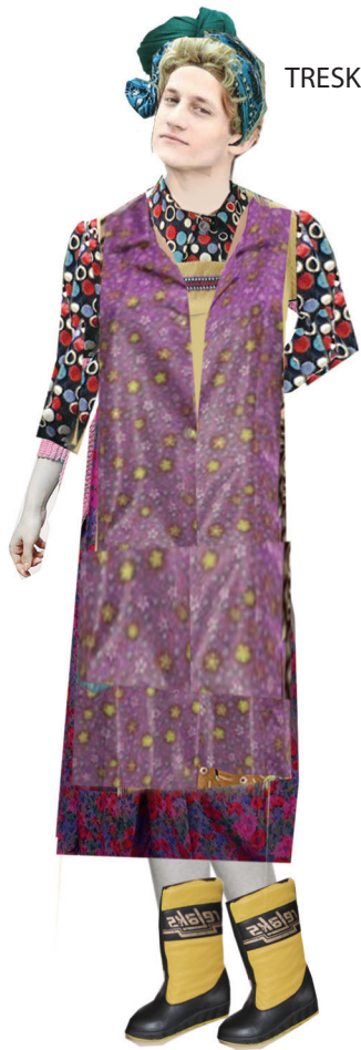
TRESKA Z TURBANEM