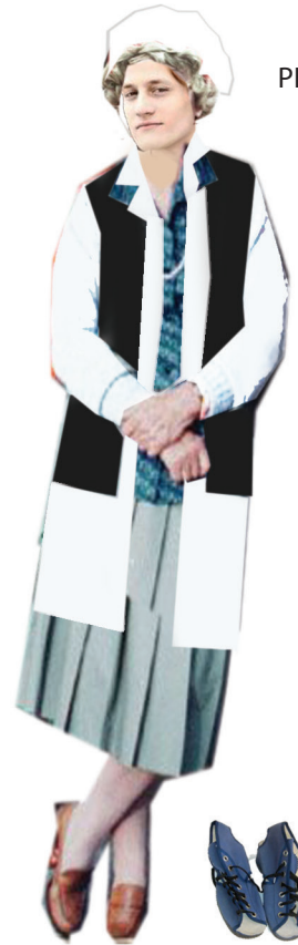
PERUKA Z CZEPKIEM